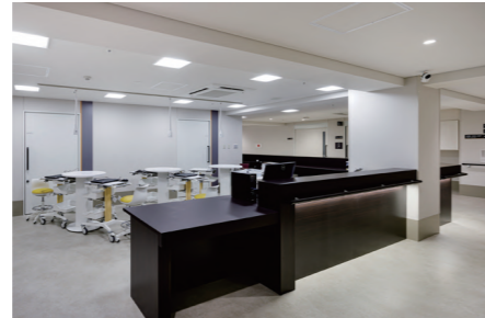
〈スタッフステーション〉