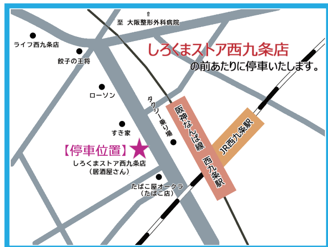
【停車位置】西九条駅前