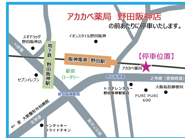
【停車位置】野田阪神駅前