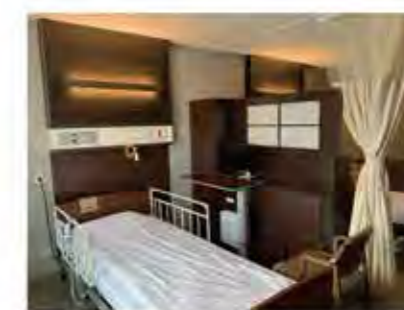
【お部屋全体(お部屋側より)】