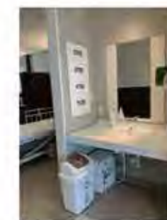
【洗面台(お部屋入ってすぐ左)】