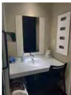
【洗面台(お部屋入ってすぐ左)】