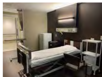
【お部屋全体(お部屋側より)】