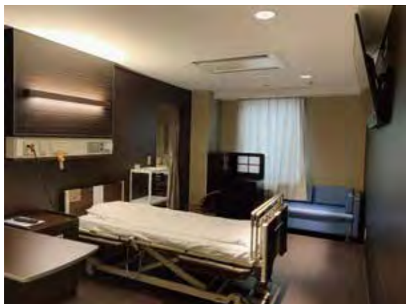
【お部屋全体(入口側より)】