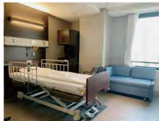
【お部屋全体(入口側より)】