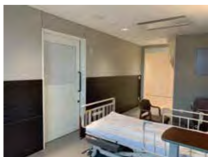
【お部屋全体(お部屋側より)】