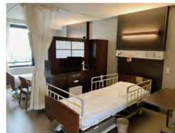
【お部屋全体(入口側より)】