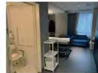
【お部屋全体(入口側より)】