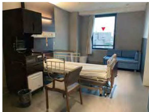
【お部屋全体(入口側より)】

※こちらのお部屋の窓は、 非常用出入口の為、終日開けることが出来ません。 予めご了承くださいませようお願い申し上げます。