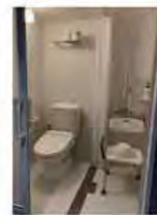
【トイレ・ユニットシャワー】