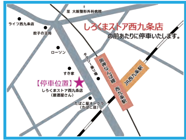
【停車位置】西九条駅前