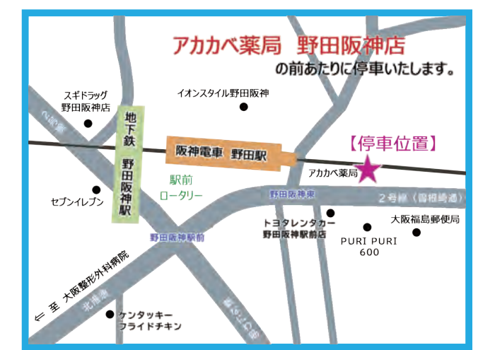
【停車位置】野田阪神駅前